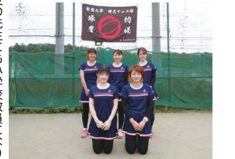
硬式テニス部(女子)主将 国際学部こども教育学科2年

―今年から女子部の主将も務めていますね。 市東 主将のほかに、主務と広報も兼務しています。硬式テニス部はそういった事務的な仕事も部員でシェアして自主的に活動しています。これまで硬式テニス部公式のTwitterがありましたが、今年からInstagramも始めました。Twitterは比較的古い内容で、Instagramは部員を募集することが目的なので硬式テニス部の日常をアップしたソフトな内容になっています。練習風景の他に、学食のメニューをアップすることもあるんですよ。そうすると「いくらですか?」「敬愛の学食はおいしいですか?」と反応してくれる高校生が結構いて、その人たちが硬式テニス部に興味を持ってくれれば嬉しいですね。