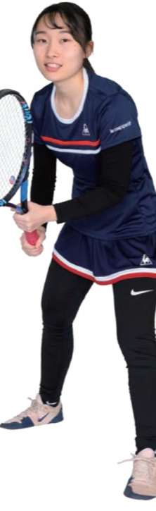
硬式テニス部(女子)主将 国際学部こども教育学科2年