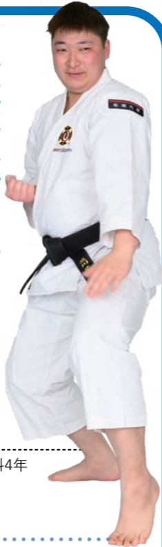
少林寺拳法部 主将 経済学部経済学科4年