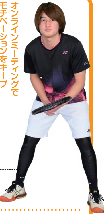
オンラインミーティングでモチベーションをキープ

―昨年ほどのような活動をしていませんでしたが、3月からは活動休止状態でしたが、そのままだと気持ちバラバラになってしまったり、モチベーションや基礎体力も落ちるので、週1回、ZOOMを使ってオンラインでミーティングをしていました。各自で取り組んだ筋トレやランニングなどの自主練習の内容を報告したり、今後の活動について話し合ったりしていました。