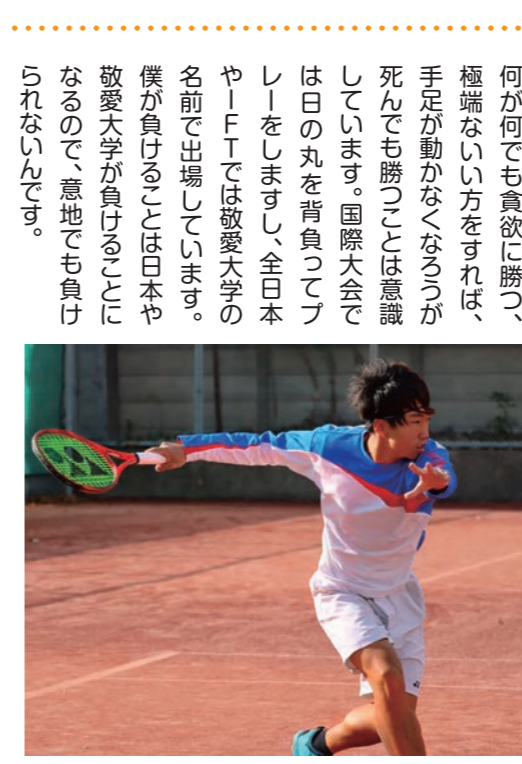
硬式テニス部(女子)主将 国際学部こども教育学科2年