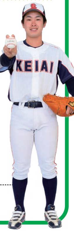
野球部 経済学部経営学科3年