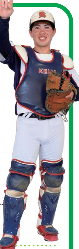
野球部 主将 経済学部経営学科3年