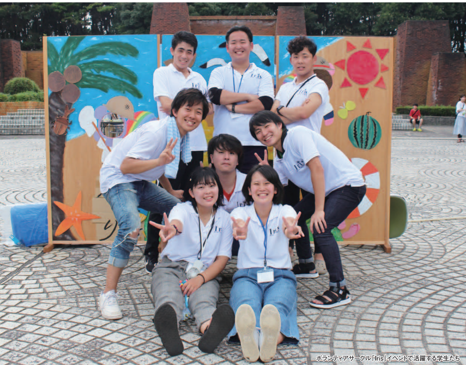
ボランティアサークル「Iris」イベントで活躍する学生たち