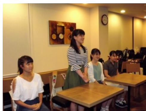
いわき市内の女子高校生4名から学ぶ時間