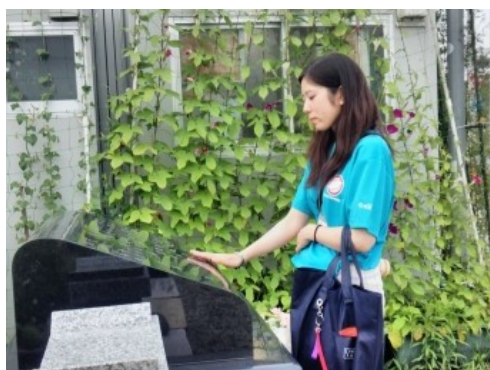
「閑上の記憶」の慰霊碑で、犠牲者に思いをはせる