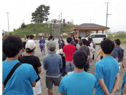
閑上日和山で合流した3大学の学生たち