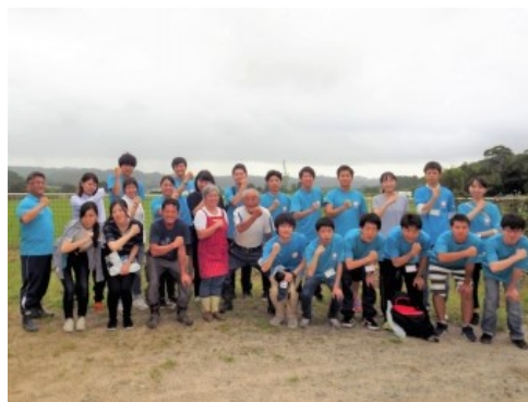
学生たちが考え出した「フェイジョア」ポーズで。

今年の「宮ボラ」でも、尚網学院大学をはじめ実に多くの皆様にお世話になりました。ここに深く御礼申し上げます。