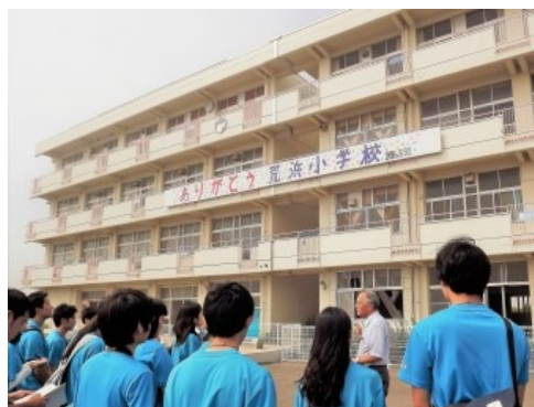
震災遺構となった荒浜小学校にて