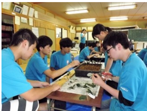
フェイジョアの挿木に挑戦中。難しい！

ゲームを使って実施しました。一人ひとりの気づきや共有したい内容が参加者全員から発表され、今年の「宮ボラ」を締めくくりました。