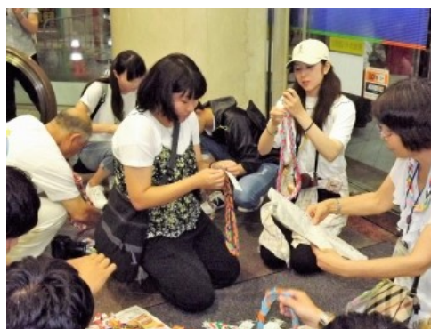
仙台平和七夕の会場で折り鶴のレイを仕上げる