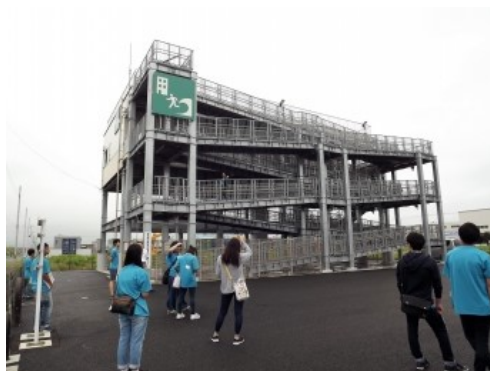
中野5丁目津波避難タワーにて

尚綱学院大学を出発後、一路南下した私たちは、途中高速道路を降り、放射線量の高い「帰宅困難地域」の一般道を通りながらいわき市に向かいました。人っ子一人いない光景が広がる中、除染作業員用に開かれているコンビニエンスストアの灯りに、驚かされました。いわき市内では、中学生時代に様々なボランティア活動に取り組んできた高校1年生4名を招き、彼女たちが取り組んできたこと、今後取り組んでいこうとしていることなどをお話しいただきました。