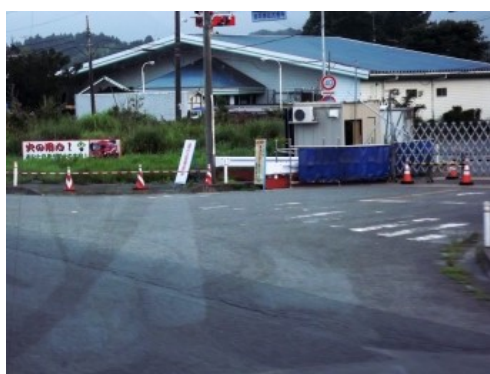
帰宅困難地域の街を、バス車窓から望む