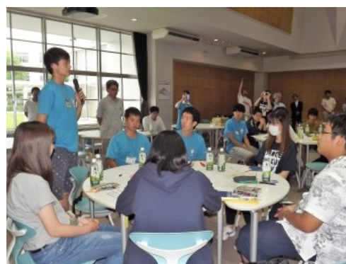
「復興とは」のテーマで各グループの議論を共有