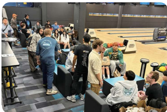
威斯コンシン州立大学の日本語履修学生とボウリングで交流

キックマン等の協力を得て、地域に根差した国際人材育成を目指したものです。学生は現地大学の寮に滞在し、日本文化紹介や千葉のスポーツ施設訪問を行いました。また、大学中のチャペルで讃美歌や敬愛学園歌を歌う経験もしました。現地大学の日本語授業支援や、子供向け「日本語土曜会」へのボランティアにも参加しました。これらを通じ、学生は異文化交流やコミュニケーションの重要性を深く学びました。詳しくは敬愛大学ホームページ「敬愛人」をご参照ください。