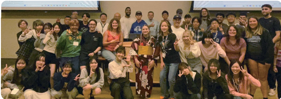
コンコルディア大学での日本文化・千葉プレゼン後の集合写真

国際学部には3つの海外研修のプログラムがあり、そのうちの1つ、海外スクリーングは夏休みや春休みの長期休暇を利用して1週間から10日にわたり海外で学びます。国際学部の教員が引率し、海外が初体験の学生も丁寧に指導します。国際人としての視野を広げる絶好の機会となります。