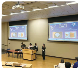
コンコルディア大学での日本文化プレゼン（日本の音楽）