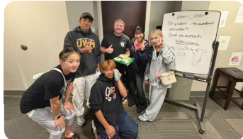
コンコルディア大学学生寮で、舎監の方と