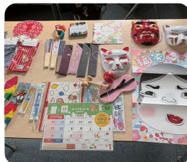
日本語土曜会の子供たちとの交流で使用したグッズ