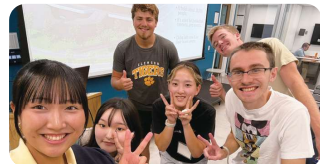
コンコルディア大学で千葉のスポーツのプレゼン後のグループ写真