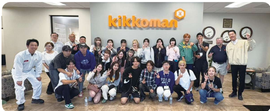
キックマン工場訪問（威斯コンシン進出52周年）