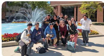
威斯コンシン州立大学の日本語履修学生と