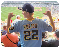
大リーグの試合観戦（ブルージェイズ対カーディナルス）