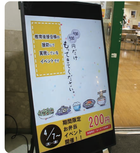
学食で、200円弁当を販売しております。毎日5種類程度のメニューがすべて200円で味わえます! 唐揚げやカツ丼などのボリュームのあるメニューもあり、学生さんにも好評です。