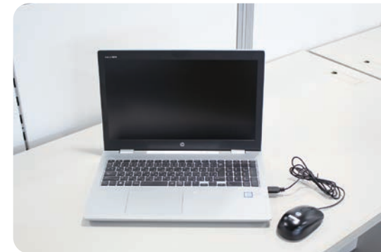
オンライン授業への対応として、学生用PC50台を購入いたしました。