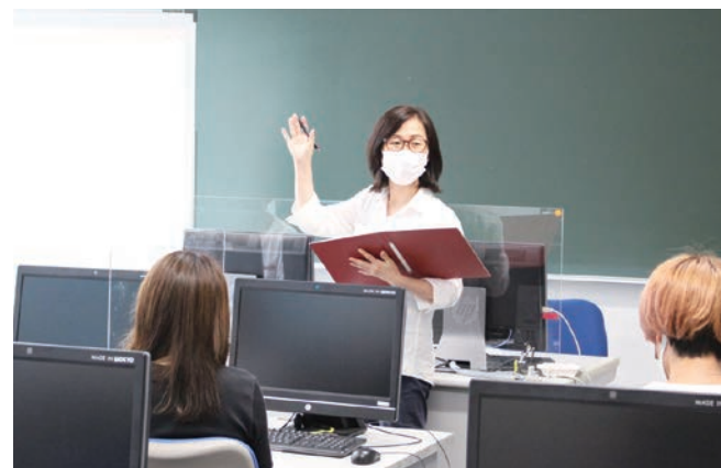
【金先生の2年生ゼミの様子】

をどう調べるべきかについて、幅広く学びます。最初はみんなの前で発表したり、発表者の研究について質問したりすることがとても難しい様子ですが、みんな徐々に慣れていきます。半期、あるいは、1年経つとみんな積極的にディスカッションに参加できるようになります。