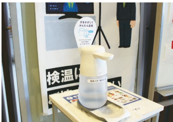
教育後援会の補助により、学内各所に自動アルコールディスペンサーを設置しております。