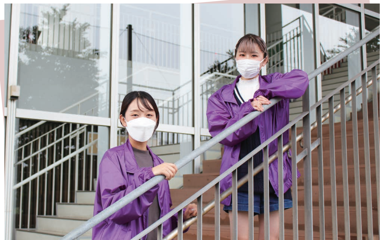
敬愛フェスティバルのオンライン開催に向け、準備をすすめる実行委員長(右)と副委員長(左)