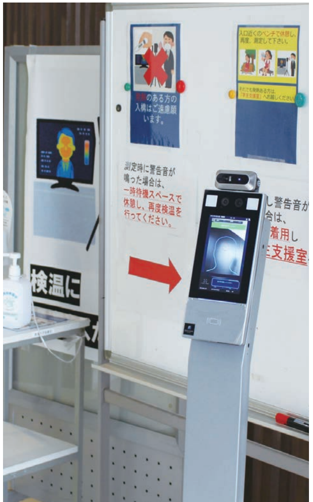
大学施設内に入る場合は、3号館1階で検温をするように徹底しております。