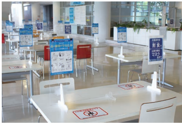
学生が使用するテーブルにアクリル板を設置。席数を減らして間隔を空けています。