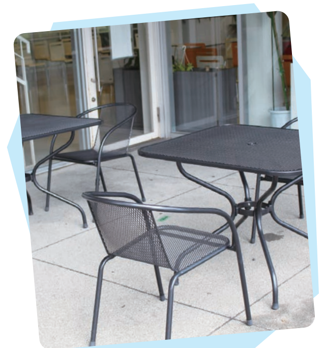
学生の休憩スペースとして、屋外テーブルセットを購入いたしました。