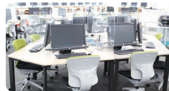
メディアセンターに、PC設置用のテーブルと椅子を寄付いたしました。