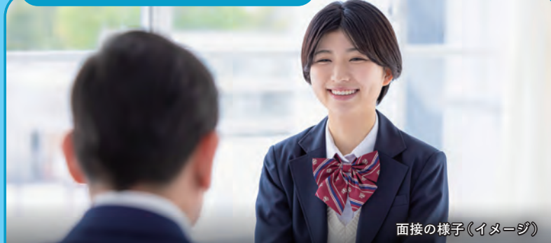
面接の様子(イメージ)